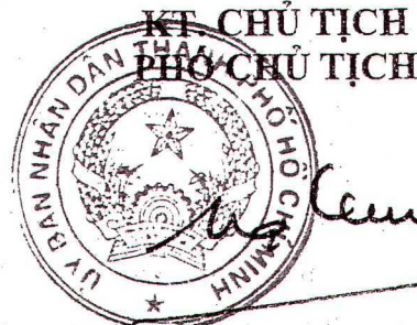
Hứa Ngọc Thuận

es/1, 13, 15 cey, ceTV, cece BANTS pelants es. 11.15 14