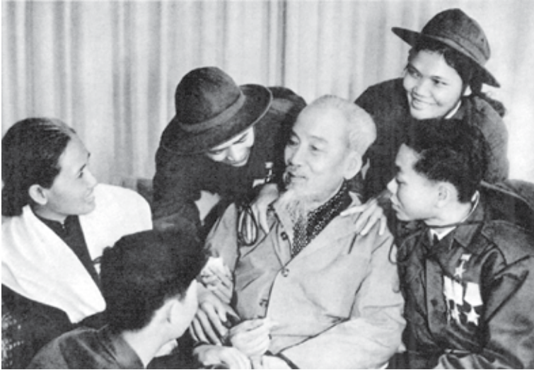
Chủ tịch Hồ Chí Minh với các anh hùng, đứng sĩ miền Nam ra thăm miền Bắc (28-2-1969)

ta càng phải nêu cao tinh thần tự lực cánh sinh , cần kiệm xây dựng nước nhà . Mọi người đều phải nâng cao tinh thần làm chủ tập thể, không sợ khó khăn, gian khổ, quyết tâm phấn đấu, làm tròn nhiệm vụ của mình.