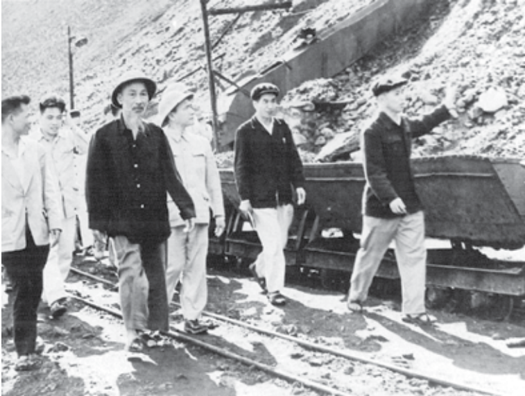
Chủ tịch Hồ Chí Minh thăm cơ sở sản xuất vận chuyển than ở vùng mỏ Quảng Ninh (tháng 2-1965)

chủ nghĩa anh em. Tình đoàn kết quốc tế vĩ đại ấy là một điều kiện rất quan trọng cho cách mạng Việt Nam thắng lợi.